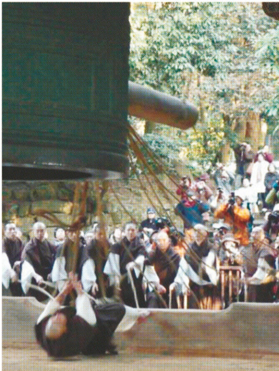
知恩院で行われる除夜の鐘の試し撞き

知恩院 除夜の鐘試し撞き見 大みそかに先駆けて、迫力満点の鐘撞きを僧侶が先行演習する。知恩院の除夜の鐘試し撞き。祇園新橋界隈を散策し、「いもぼう平野家本店」で名物「いもぼう御膳」をいただいた後は、大鐘楼前で試し撞きを見学します。