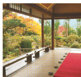
紅葉と不断桜を同時に楽しめる実光院

京懐石でまなぶ大人のたしなみ「二軒茶屋 中村楼」坂本龍馬が愛した田楽豆腐、伊藤博文が愛した京風情。室町から480年来伝わるおもてなしの心で提供する老舗料亭「二軒茶屋 中村楼」でこだわりの美味を堪能しながら、祇園東の人気舞妓、満彩光さん「写真」