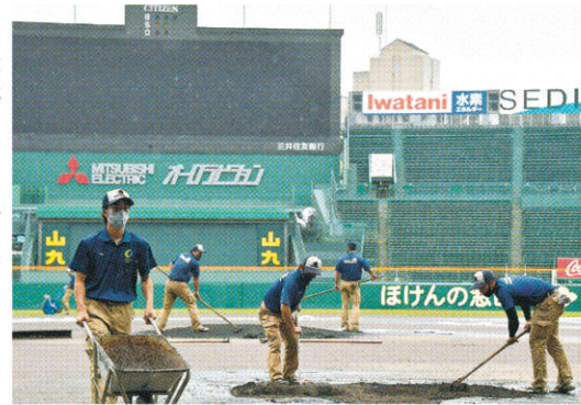
甲子園球場のグラウンド整備をする阪神園芸社員ら

天候が荒れば荒れるほど、その存在が際立つグラウンドキーパー。その仕事ぶりは今や「神整備」と呼ばれ、阪神甲子園球場所属の「阪神園芸」の社名は一躍有名になりました。ただ、そんなファンの評価の裏側には、計り知れないプレッシャーも抱えています。